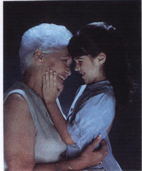
Luchamos por tu calidad de vida y la de los tuyos.