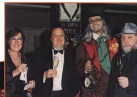
Franca camaradería en el 5to Vinos, Imágenes y Paladar.