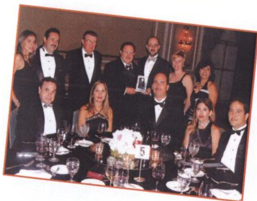
5ta Gala de Vinos, Imágenes y Paladar.