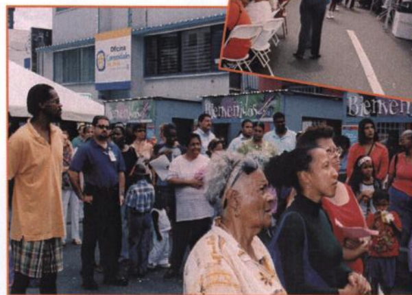
Prevención de Salud Cardiovascular - Feria de Salud 2004